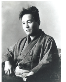
1933(昭和8)年 35歳ごろの尾崎士郎 (尾崎士郎記念館蔵)

▶問合先 龍子記念館(〒143-0024中央4-2-1) ☎FAX3772-0680