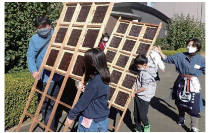
大森の伝統を学ぶ海苔づけ体験の様子

抽選で1各30名225名 問合先へ往復はがき(記入例参照。1希望日も明記)。10月31日消印有効 問 大森 海苔のふるさと館 (〒143-0005平和の森公園2-2) ☎5471-0333 FAX5471-0347