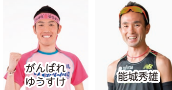
がんばれ ゆうすけ