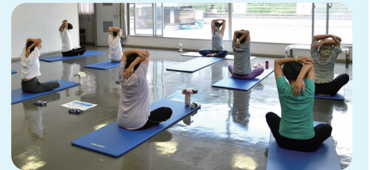
かんたんヨガ多摩川台教室