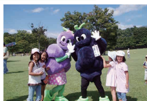
巨峰の王国まつり