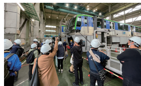
東京モノレール車両基地(昭和島)見学