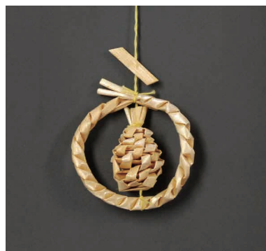
麦わら編み細工の制作物

大森麦わら細工の歴史を学び、復元された麦わら編み細工の技法を体験します。 対 中学生以上の方 7月14日(日)午前10時～午後4時 定 先着16名 申 問合先へ電話 会 郷土博物館 ☎3777-1070 FAX3777-1283