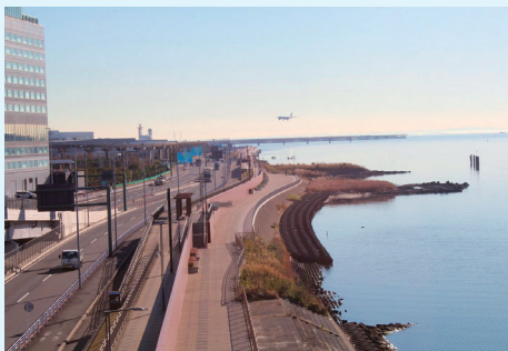
およそ2km続く散策路はお散歩やジョギングにおすすめ!

羽田空港のそば、多摩川沿いにあるソラムナード羽田緑地をご存じですか。4月に全面開園したこの緑地には、四季を感じることができる散策路、周囲を一望できる展望テラスや休憩施設が整備。多摩川の開放感あふれる景色の中、間近で飛行機を見ることができますよ。