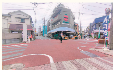
7本の道が1か所で交わる珍しい交差点