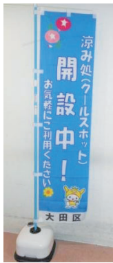
涼み処(クールスポット)のぼり旗

高齢者は体内の水分量が不足しやすいため、特に注意が必要です。こまめな水分補給を心がけ、扇風機やエアコンを活用しましょう。涼み処(クールスポット)として一部の公共施設を開放しているので、お出かけの際はご利用くだ