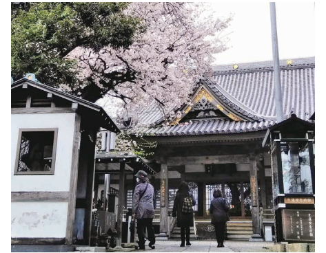
コース一例「萬福寺」(過去の実施風景)