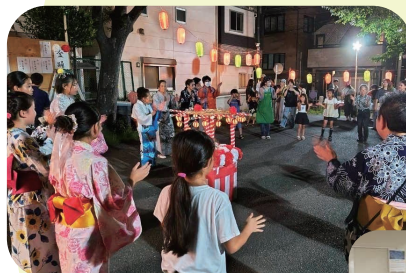
盆踊り会本番は盛り上がり、大成功でした

これらの取り組みを通じて多世代交流が生まれ、地域全体で楽しい時間を共有することができ、手応えを感じました。参加したこどもたちから「楽しかった、またやってね」という声も多く、今後も継続し、地域の輪を広げていきたいと思います。