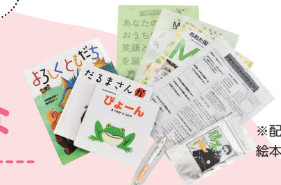
※配布する絵本などの例