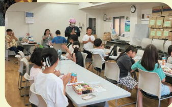
学年を越えて仲を深めるこどもたち