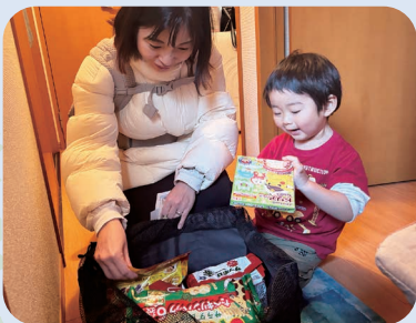
こどもの笑顔を見られることがやがい