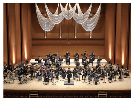
令和5年度開催の様子