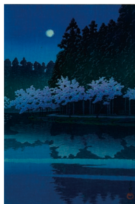
川瀬巴水 「井之頭の春の夜」 昭和6(1931)年