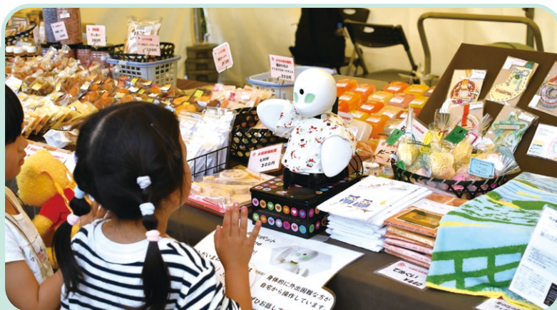
▼離れた場所から操作できるロボット(上記写真)を使った商品販売

2月開催のNPO・区民活動フォーラム(下記参照)に出展しますので、活動を知ってもらい、一緒に参加していただくと嬉しいです。