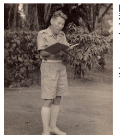
南方戦線でスケッチを描く龍子 昭和17(1942)年