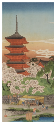
高橋松亭 飯題「春の浅草寺」 明治42(1909)年～ 大正5(1916)年