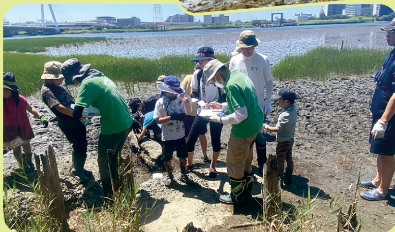
▲干潟の魅力を感じる自然観察会