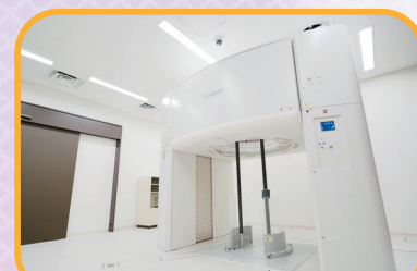
立ったまま全身撮影可能な「立位CT」