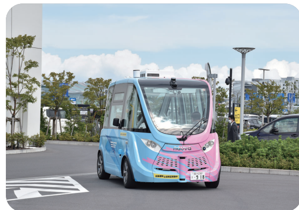
自動運転バスは、どなたでも予約せずに乗車できます

自動運転レベルとは、車のハンドルやブレーキ操作が、システムによる自動運転でどの程度まで可能なのかを示したレベルです。HICityでは、特定の条件下で完全自動運転が可能となるレベル4の走行をめざしています。