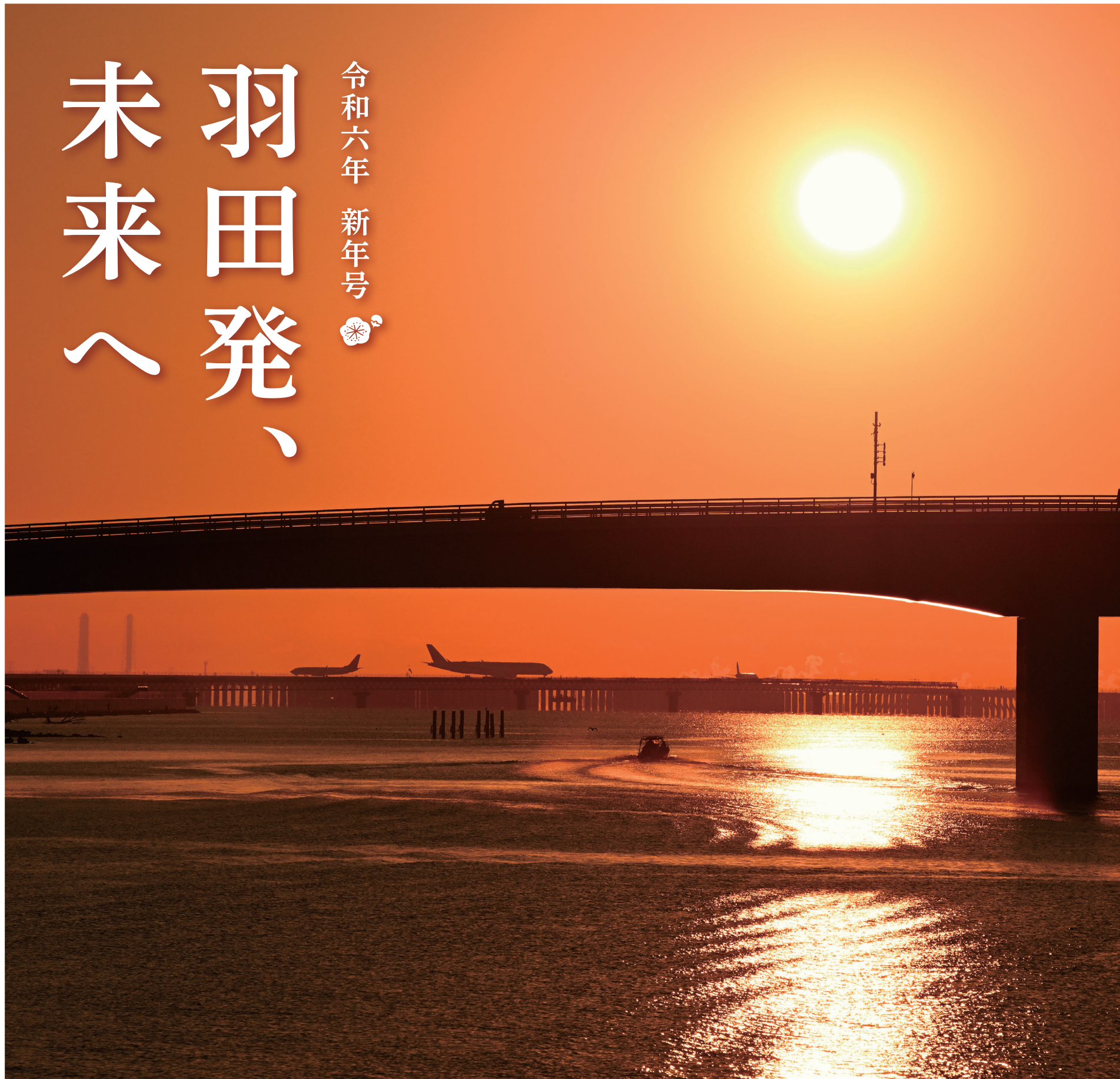
羽田インベーションシティ付近からの日の出