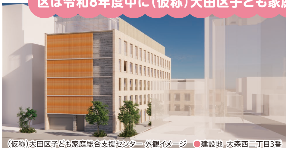
(仮称)大田区子ども家庭総合支援センター 外観イメージ ●建設地 大森西二丁目3番

「(仮称)大田区子ども家庭総合支援センター」を新たに設置します。児童相談所・一時保護所・子ども家庭支援センターを一体的に整備し、こどもたちの生きる権利や育つ権利を守り、虐待防止対策を強化します。