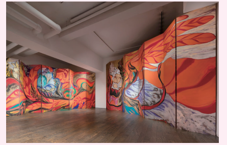
濱田樹里《創世譜～歓喜～》の展示イメージ