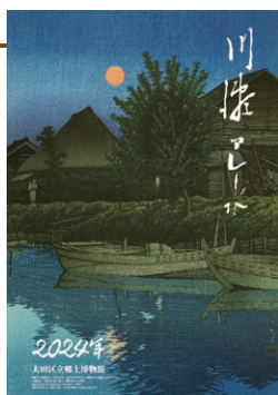
表紙「昇る月(森ヶ崎)」 昭和6(1931)年10月作