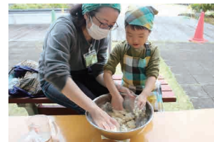
アウトドアクッキング