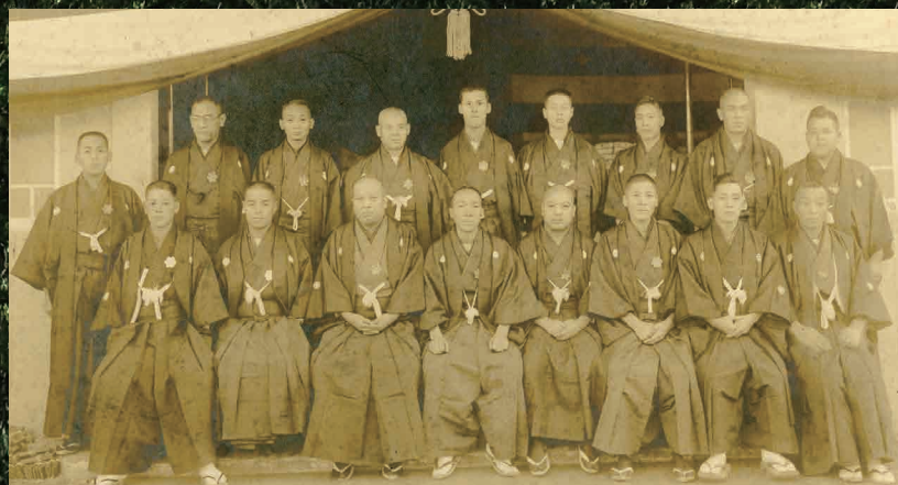
▲大森乾海苔問屋組合事務所新築記念写真(大正15(1926)年)