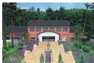
北アルプス展望美術館