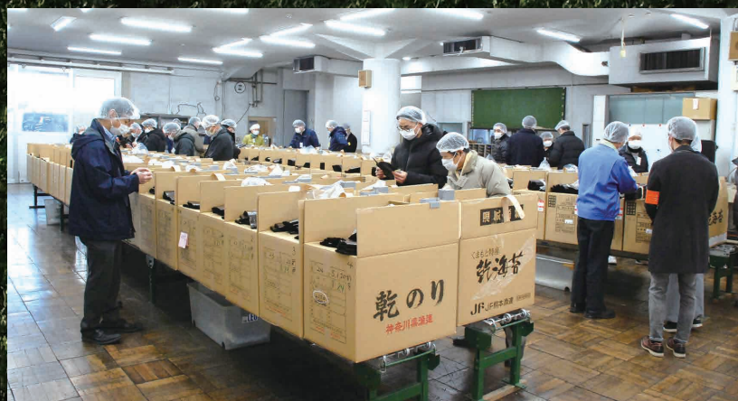
▲大森海苔会館での入礼会