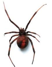
セアカゴケグモ(雌)

発見した場合は素手で触らず、市販の殺虫剤を使用するか、靴底で踏みつぶすなどをして駆除をした上、問合せへご連絡ください。セアカゴケグモの詳細な特徴などは、区HPをご覧ください。