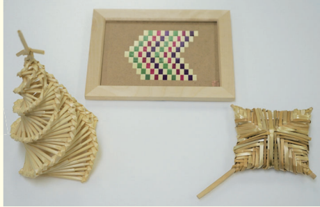
麦わら細工の作品例