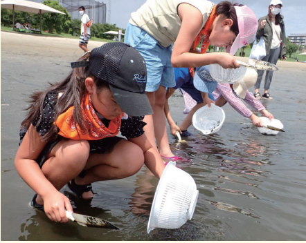
浜辺の生き物探検隊