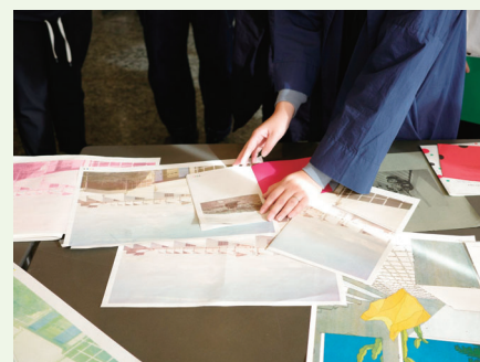
ポスターやステッカーなど作成