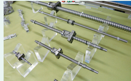
ボールねじ 中央のナットが滑らかに動きます

(株)伊和起ゲージは、大田区で唯一ボールねじの技術を持つ企業。ボールねじとは、モーターなどの回転運動を直線運動に変換する機械要素部品で、駅のホームドアや介護ベッドなど身近なものにも使われています。普段は立ち入ることのできないエリアと最先端技術に参加者は興味津々。