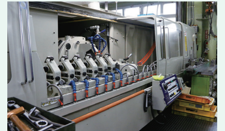
ボールねじを研削する機械