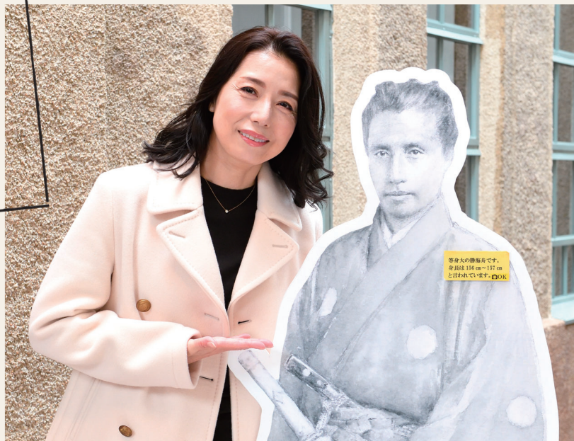
高橋ひとみ 俳優。昭和54年のデビュー以来、舞台やテレビドラマ、映画などで活躍。平成31年2月に大田区観光PR特使に就任。区主催イベントへの参加やおおたの魅力を発信中