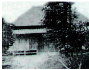
海舟が構えた洗足軒