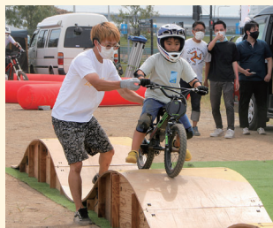
電動バイクの試乗

7・8月は「だれでも! PARK!! 2022」。50mの布地に思いっきりお絵描きなどを楽しみました。9月は「Sunday E Park」。電動バイクの試乗や、プロのトライアルライダーのパフォーマンスなどが行われました。参加者はまちなかの公園とはちょっと違った遊びを楽しんだ様子。実際にどんな公園ができるのか、期待が膨らみます。