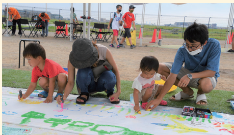
キャンパスは無限大!