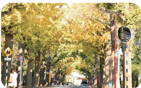
街路樹の保全・更新 田園調布イチョウ並木(田園調布三丁目)

まちなかのみどりには、良好な景観や脱炭素化への効果など、さまざまな機能があります。こうした機能を最大限発揮するために、今あるみどりを将来に引き継ぐことが重要です。そのために区は、樹木の適切な管理や更新を行っています。