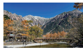
上高地河童橋

▶問合せ 地域力推進課区民施設担当 ☎5744-1229 FAX5744-1518