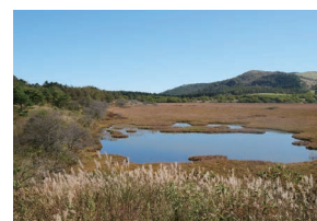
車山高原八島ヶ原湿原

▶対象 代表者が区内在住・在勤の方 ▶日程 10月16日(日)・17日(月)(1泊2日) ▶費用 29,800円(小学生以下は28,700円)から ▶定員 抽選で23名 ▶問合せ 休養村とうぶ(長野県東御市和6733-1) ☎0268-63-0261