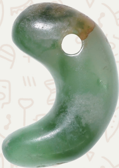
宝萊山古墳のヒスイ製勾玉(郷土博物館所蔵)