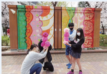
入新井地区(探検クイズラリー)

▶ 問合先 地域力推進課青少年担当 ☎5744-1223 FAX5744-1518