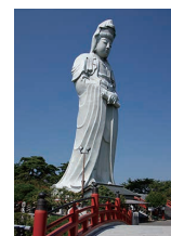
高崎白衣大観音