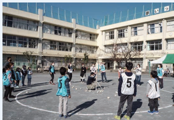
蒲田西地区(子どもまつり)