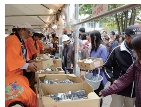
巨峰の王国まつり

▶ 問合先 休養村とうぶ(長野県東御市和6733-1) ☎0268-63-0261