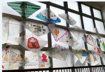
矢口地区(凧配布展示)