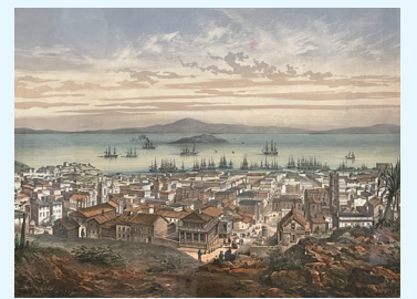
サンフランシスコの風景画