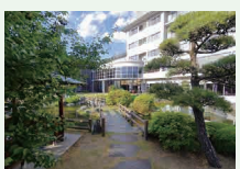
▲シャトレゼホテル石和

▶利用方法 利用日の3か月前～3日前に各施設へ電話予約。チェックイン時に宿泊者全員の本人確認を行います。区内在住の方は身分証明書、在勤の方は身分証明書のほかに在勤証明書が必要です。