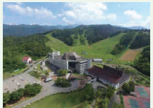
▲ニュー・グリーンピア津南