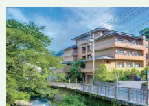
▲ゆがわら水の香里