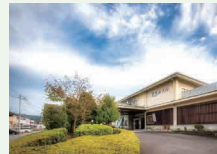
▲伊豆長岡温泉京急ホテル