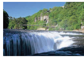
▲吹割の滝