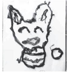
海藻おしばの作品例