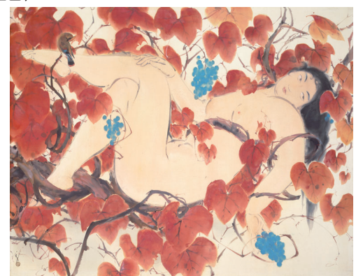
川端龍子《山葡萄》昭和8(1933)年