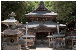
▲北向観音堂