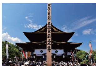
▲善光寺御開帳