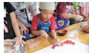
▲アウトドアクッキング