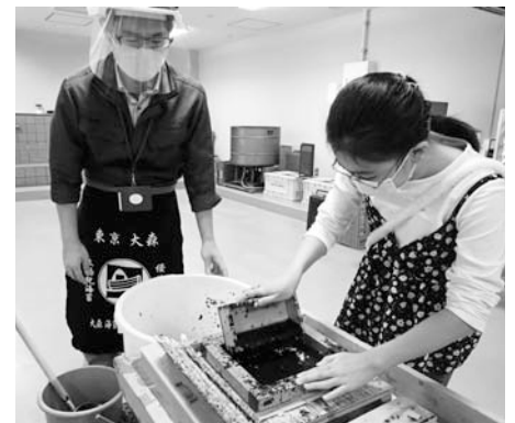
海苔づけ体験の様子