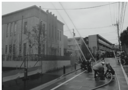
▲勝海舟記念館消防訓練の様子(令和2年1月)