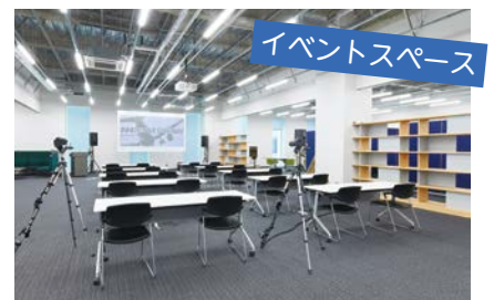
イベントスペース

▶問合せ (公財)大田区産業振興協会 ☎5579-7971 FAX5579-7972