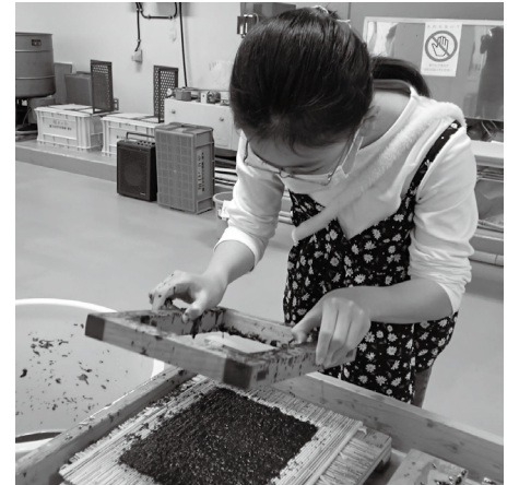
海苔づけ体験の様子

● かつての大森伝統の海苔づくりを学び、乾し海苔づくりを体験します。 ● 小学3年生以上 ● 11月20日(土)・28日(日)、12月4日(土)・12日(日)午前10時～正午 ● 先着各10名 ● 問合先へ電話 ● 大森 海苔のふるさと館 ☎5471-0333 FAX5471-0347