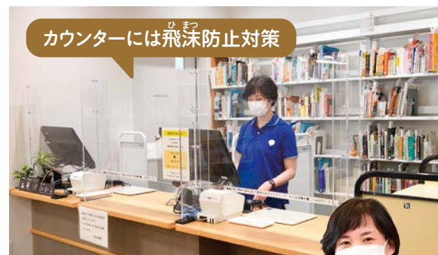
カウンターには飛沫防止対策