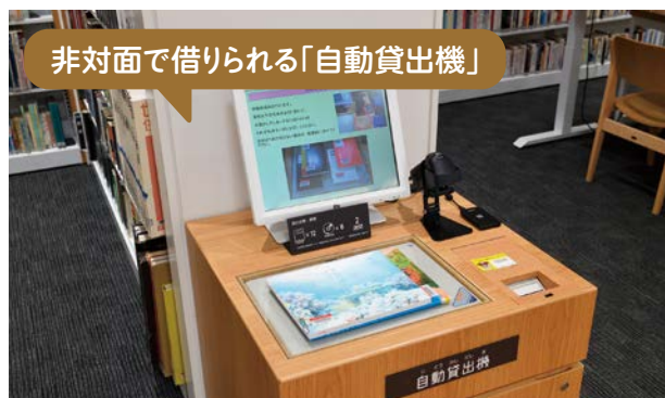
非対面で借りられる「自動貸出機」