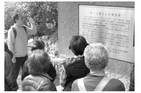
大森貝塚庭園(過去の実施風景)

問合先へ往復はがきかFAX(記入例参照)。10月29日必着 ※1人1通 龍子記念館(〒143-0024中央4-2-1) ☎FAX3772-0680