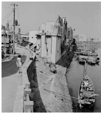
羽田の弁天橋付近から海老取川を眺める(昭和37年8月1日)

10月23日(土)～12月26日(日)午前9時～午後5時 ※月曜休館 当日会場へ 郷土博物館 ☎3777-1070 FAX3777-1283