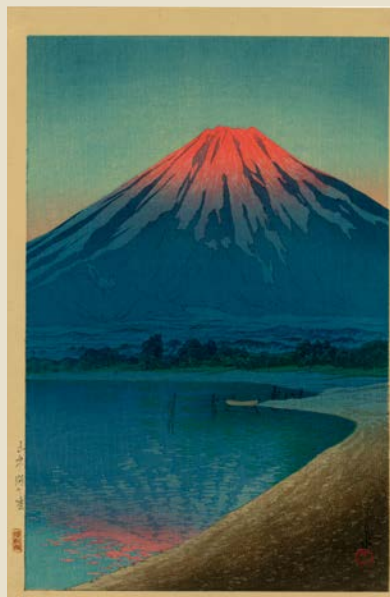
「山中湖の暁」昭和6年8月写