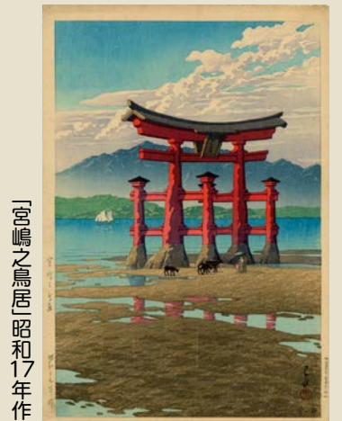
「宮嶋之鳥居」昭和17年作

川瀬巴水が旅した日本各地の風景版画をスケッチブックとともに約200点紹介します。