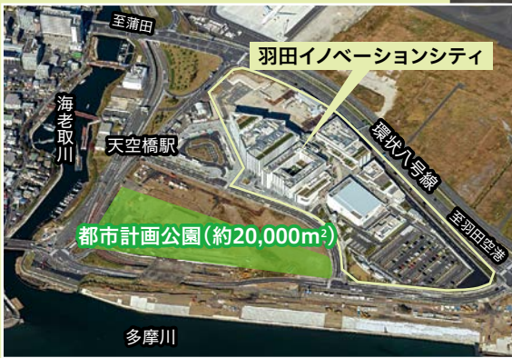
※令和2年11月時点 UR都市機構提供の航空写真を使用し、大田区が作成