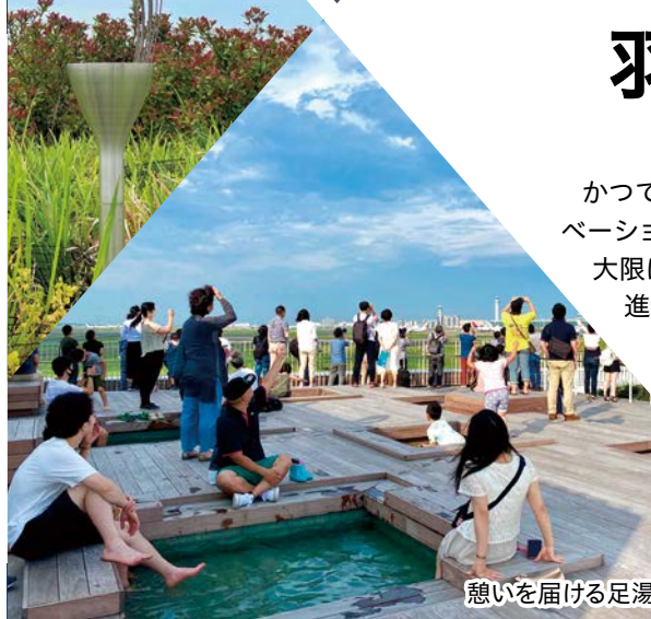
憩いを届ける足湯スカイデッキ