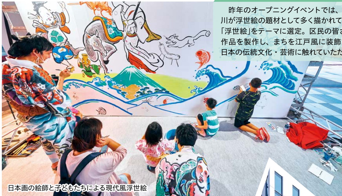
日本画の絵師と子どもたちによる現代風浮世絵

昨年のオープニングイベントでは、羽田や多摩川が浮世絵の題材として多く描かれていたことで、「浮世絵」をテーマに選定。区民の皆さんとともに作品を製作し、まちを江戸風に装飾することで、日本の伝統文化・芸術に触れていただきました。