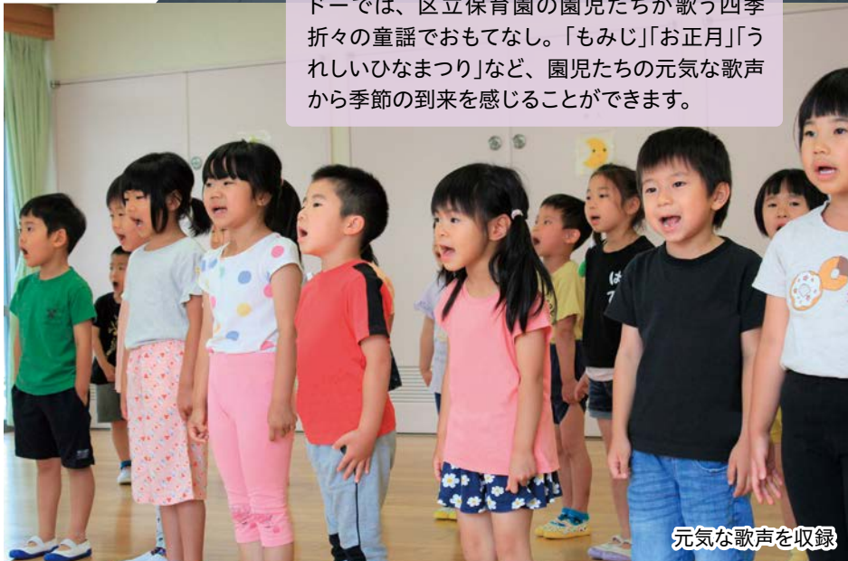
元気な歌声を収録

空港に臨む足湯に彩りを添える稲穂型の照明。今も昔も多くの人に愛されている穴守稲荷の神紋である稲穂をモチーフにしており、区内企業・団体による技術とまちの発展への思いが結集されています。