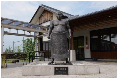
▲東御市出身の天下無双力士「雷電像」