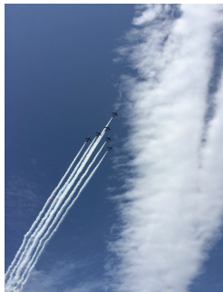
東松島市自慢のブルーインパルス▶

▶問合先 文化振興課文化振興担当 ☎5744-1226 FAX5744-1539