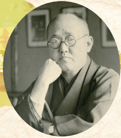
かわせ はずい 川瀬巴水

約40年にわたる画業生活の大半を大田区内で過ごし、旅から旅へと全国を歩き、古き良き日本の風景を描き続けた新版画の第一人者、川瀬巴水(本名は川瀬文治郎)。