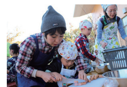
▲アウトドアクッキング