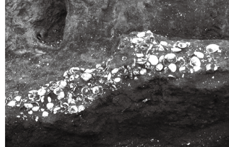
熊野神社遺跡の貝塚