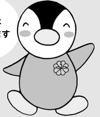
東京都民生委員・児童委員キャラクター「ミンジー」