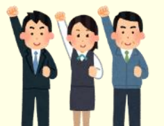
関係機関との 連携