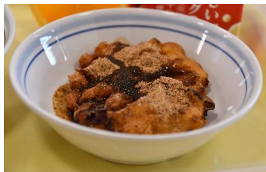
SDGsについて考えよう & たこぺったん販売