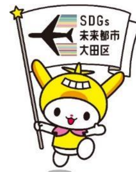
はねぴよんを探せ! 会場内のキーワードを4つ探して はねぴよんグッズ(限定品)がもらえる