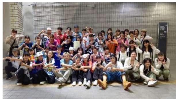
OTAダンス!ダンス!カーニバル!! 技術指導しているSEGA SAMMY LUX と地域部活動チームのダンス発表