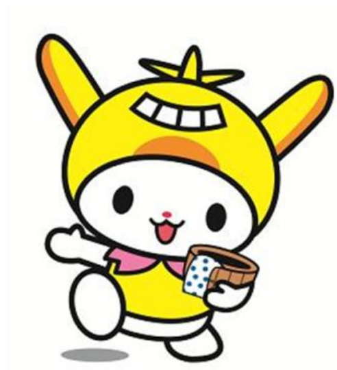
大田区公式PRキャラクター はねぴよん ©大田区