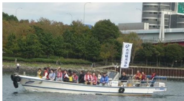
フェスタクルーズ (6年ぶり復活)