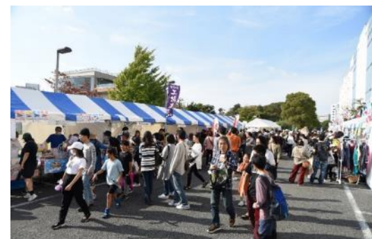
ごちそうストリートと 国際交流ブース