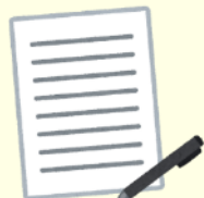
サポートプラン の作成