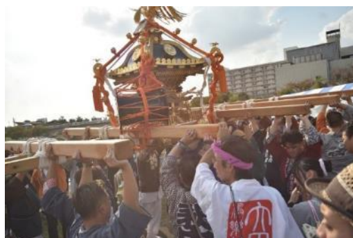
OTAパレード ～民踊・太鼓・みこしのコラボ～