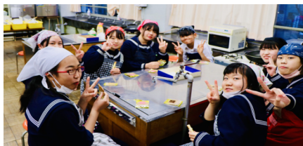
焼き上がりまでのおやつ休憩 (上) みんなで試食 (下)