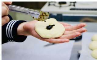
慣れないながらも生徒の皆さん、成型から焼き上がりまで頑張っていました。