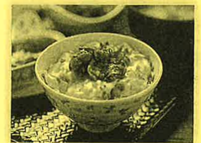
〈できあがりイメージ〉