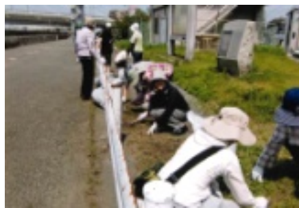
みんなで仲良く清掃作業

5月27日(日)当日は天候にも恵まれ、朝9時に大師橋下広場に集合し、会長挨拶後、大師橋広場から高速道路下河川敷までの範囲を地域別に分かれて清掃作業を行いました。