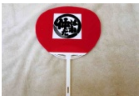
町会のうちわを作成しました

神輿が町内に入ると、町会の人たちがうちわを振って盛り上がりました。今年の祭礼は台風の影響を心配していましたが、町会が一つになった祭礼でした。