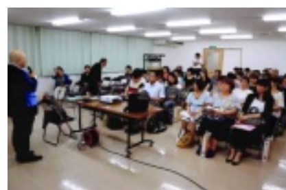
SNSについて熱心に学ぶ

SNSが発達する世の中とはいえ、大切なのは親子の対話であり、地域や社会との結びつきも子どもの育ちには必須であることを確