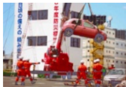
消防技術の進歩を実感

内へも、外からドローンへ指示できるようです。消防技術が日々進歩し、自分達の生活が守られている事に驚きました。