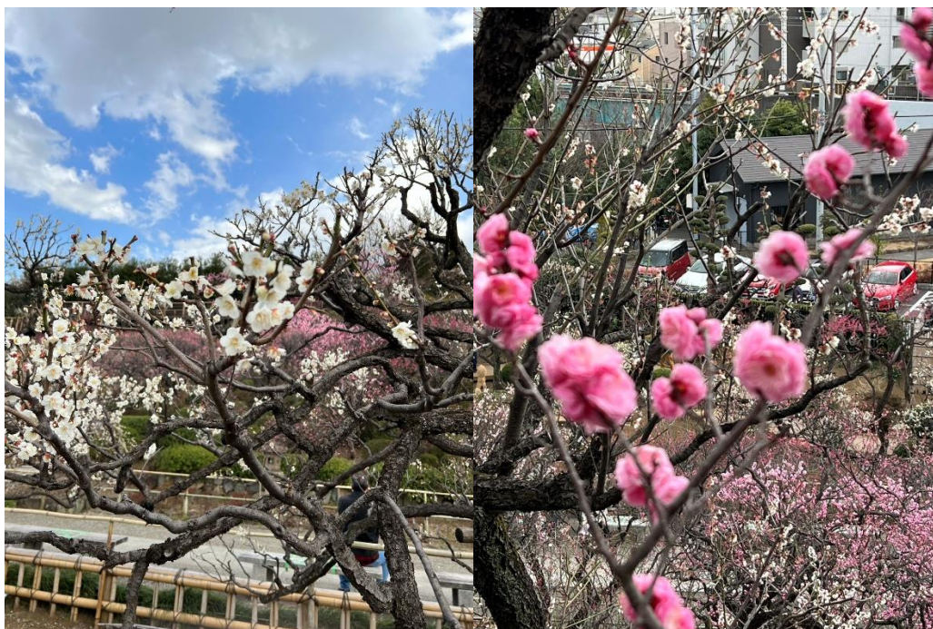
写真は去年の開花時の様子です