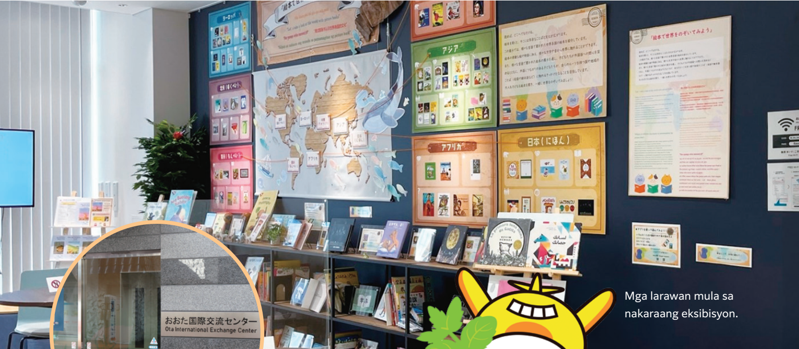
Mga larawan mula sa nakaraang eksibisyon.