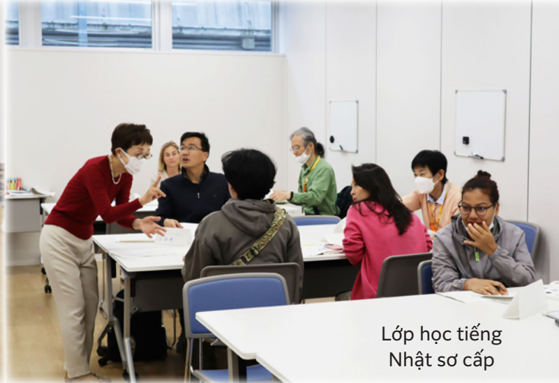
Lớp học tiếng Nhật sơ cấp