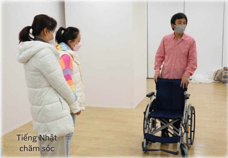
Tiếng Nhật chăm sóc