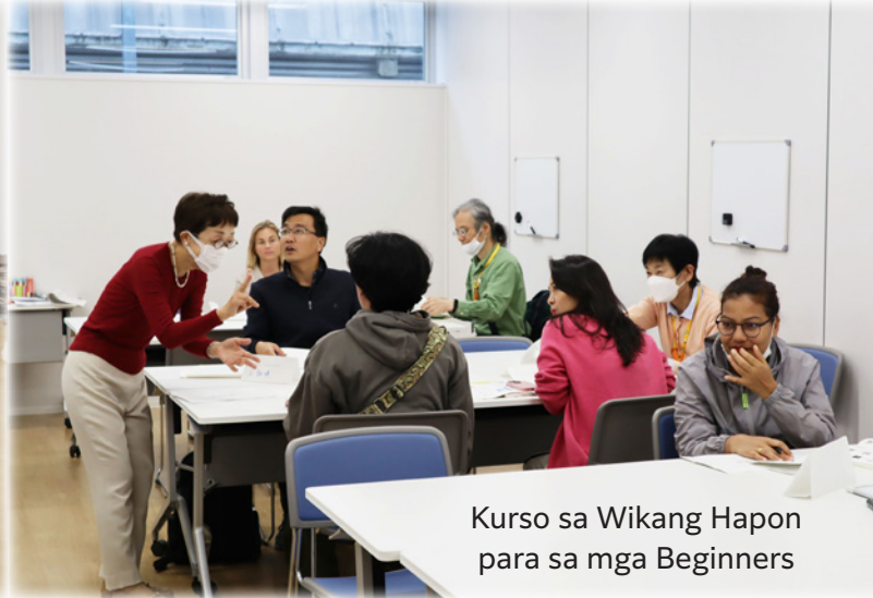
Kurso sa Wikang Hapon para sa mga Beginners