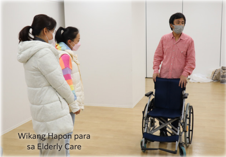
Wikang Hapon para sa Elderly Care